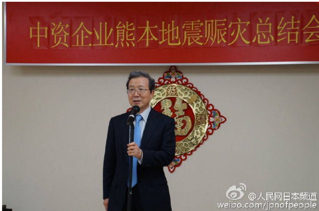
中華人民共和國駐日本國大使程永華氏

中華人民共和國駐日本國大使館經濟商務處は、日本時間 4 月 28 日夜、「中資企業による熊本地震災害救援総括会議」を開催し、熊本地震の寄付に積極的に参加した在日中資企業に対して表彰を行いました。中華人民共和國駐日本國大使程永華氏、全日本中國企業協會連合會會長彭卜鋼氏が會議に出席し中資企業代表者に表彰状を授与し、また、中華人民共和國駐日本國大使館公使劉亜軍氏が會議の司会を務めました。會議には約 40 社の中資企業代表が列席しました。